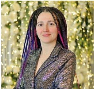
ФОТО У ВЕБ ДИЗАЙНІ Семестр 8 (весна 2023)