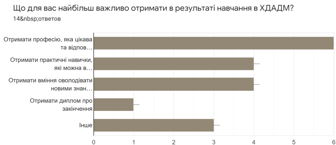
Рис.1 – Кількість варіантів відповідей на питання «Що для вас більше важливо отримати в результаті навчання в ХДАДМ?»

7,1% респондентів другим номером у списку пріоритетів указали, що для них важливо отримати диплом про освіту (рис.1).