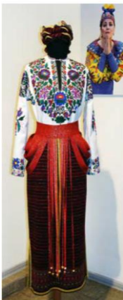
Рис. 5. Забашта Г. Костюм "За народними мотивами", [2]