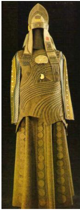
Рис. 1. Семикіна Л. Костюм "Князь Дерево" [1]