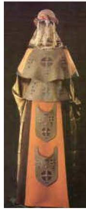
Рис. 3. Семикіна Л. Костюм "Мирославна" [1]