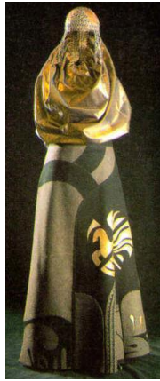
Рис. 2. Семикіна Л. Костюм "Скифська жриця Грифон" [1]